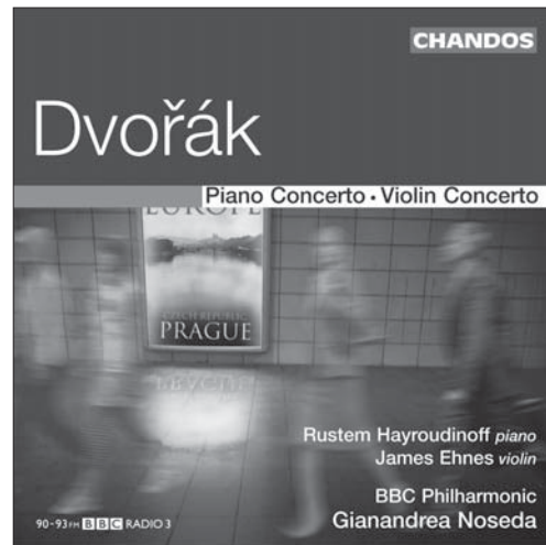
Dvořák Piano Concerto • Violin Concerto CHAN 10309