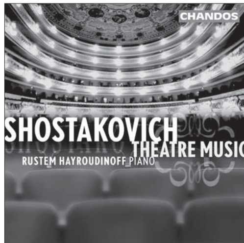
Shostakovich Theatre Music CHAN 9907

You can now purchase Chandos CDs online at our website: www.chandos.net For mail order enquiries contact Liz: 0845 370 4994