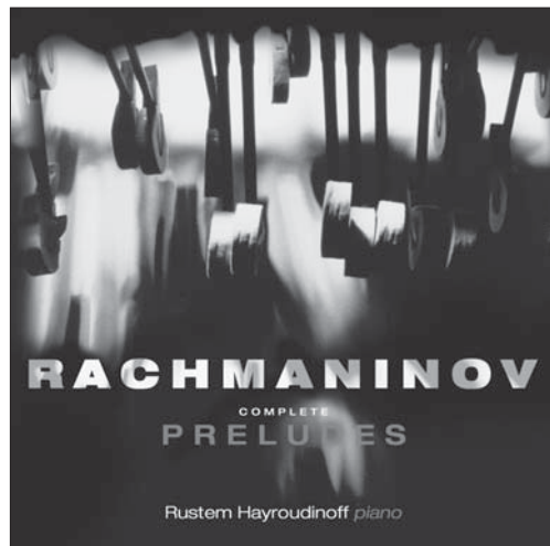
Rachmaninov Complete Preludes CHAN 10107